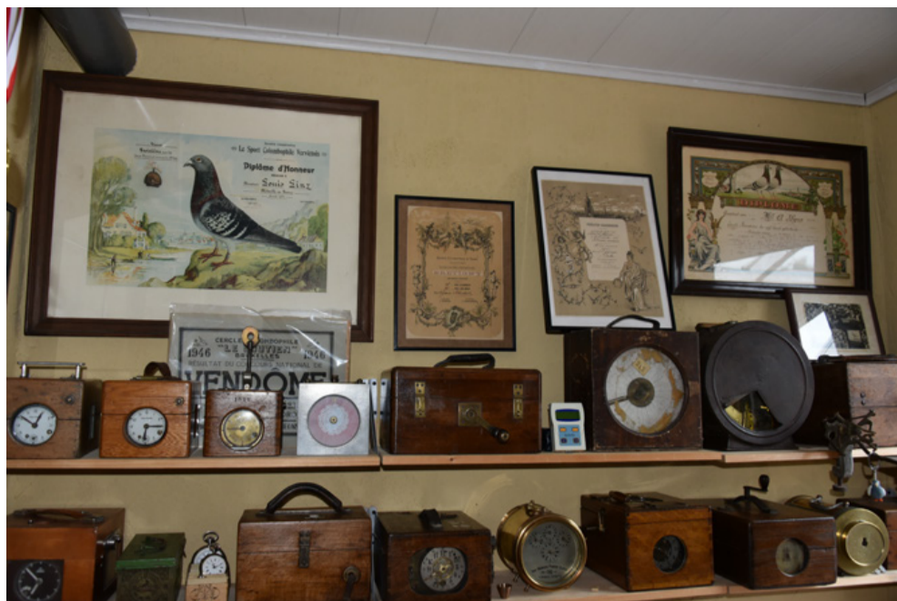
Diverse duivenklokken en oorkondes.