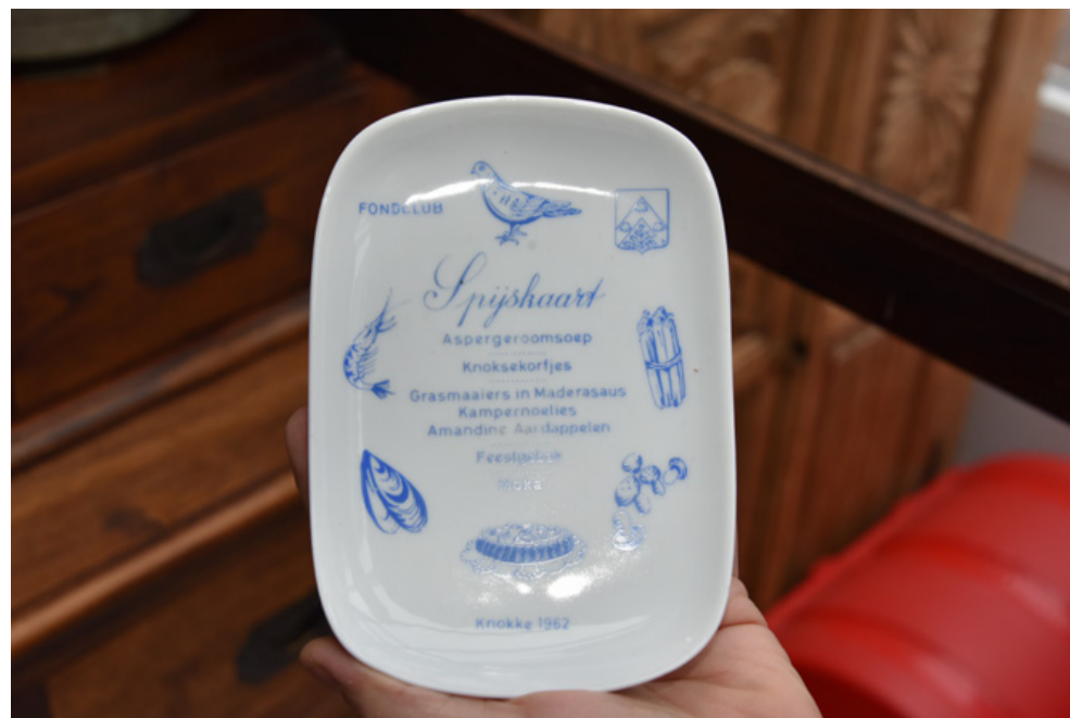
Een oud menubordje.

Wat hij of zij zeker niet mag doen is zomaar iets weggooien, maak er een foto van en contacteer mij a.u.b. Om maar een voor-