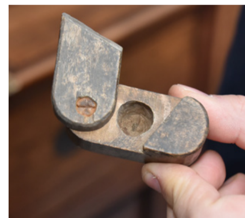
Opbergdoosje voor een gummiring.

In de zomer word er in principe minder tijd gestoken in het documenteren, dat is een mooie bezigheid voor de lange winteravonden. De markten vol rommel en antiek worden wel afgeschuimd maar eerder beperkt. Gemiddeld mag je toch rekenen op 2 à 3 uur per dag.