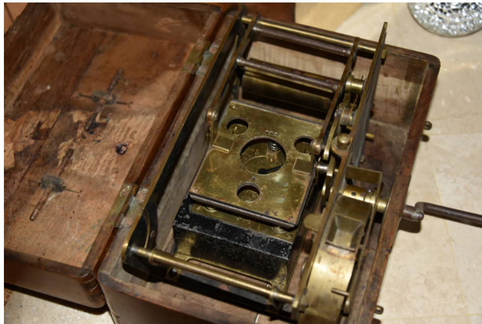
Een constateur Lefebvre uit 1895.

Maar met Edgards vrijgevigheid, en zijn inzicht dat ik zijn gift ernstig zou nemen en mijn belofte aan hem niet zou breken, is het echte werk inderdaad begonnen. De trein was toen definitief vertrokken. In de club werd gekeken en onze leden werden bevroegd. Zoals dat toen in 1997 nog ging werd de koopjeskrant gekocht om te zoeken naar aanbiedingen en er werden natuurlijk ook zoekertjes geplaatst. De verzameling breidde zich langzaam uit en in het seizoen 1998 stelde een lid van onze